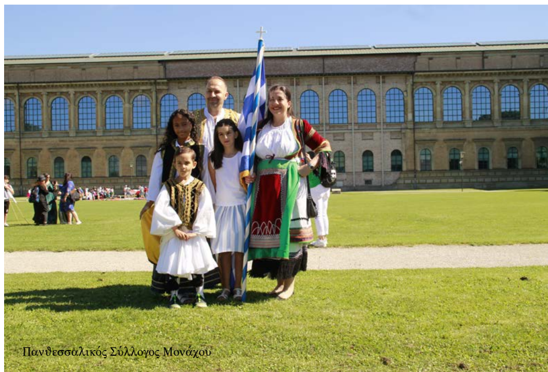
Πανθεσσαλικός Σύλλογος Μονάχου