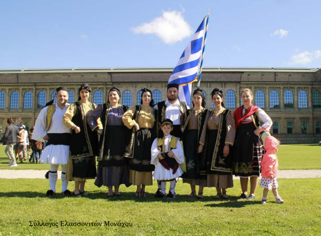
Σύλλογος Ελασσονιτών Μονάχου