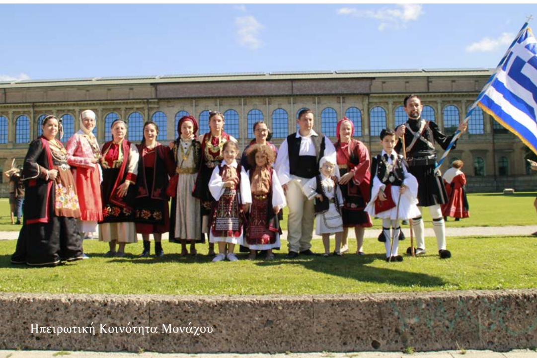
Ηπειρωτική Κοινότητα Μονάχου