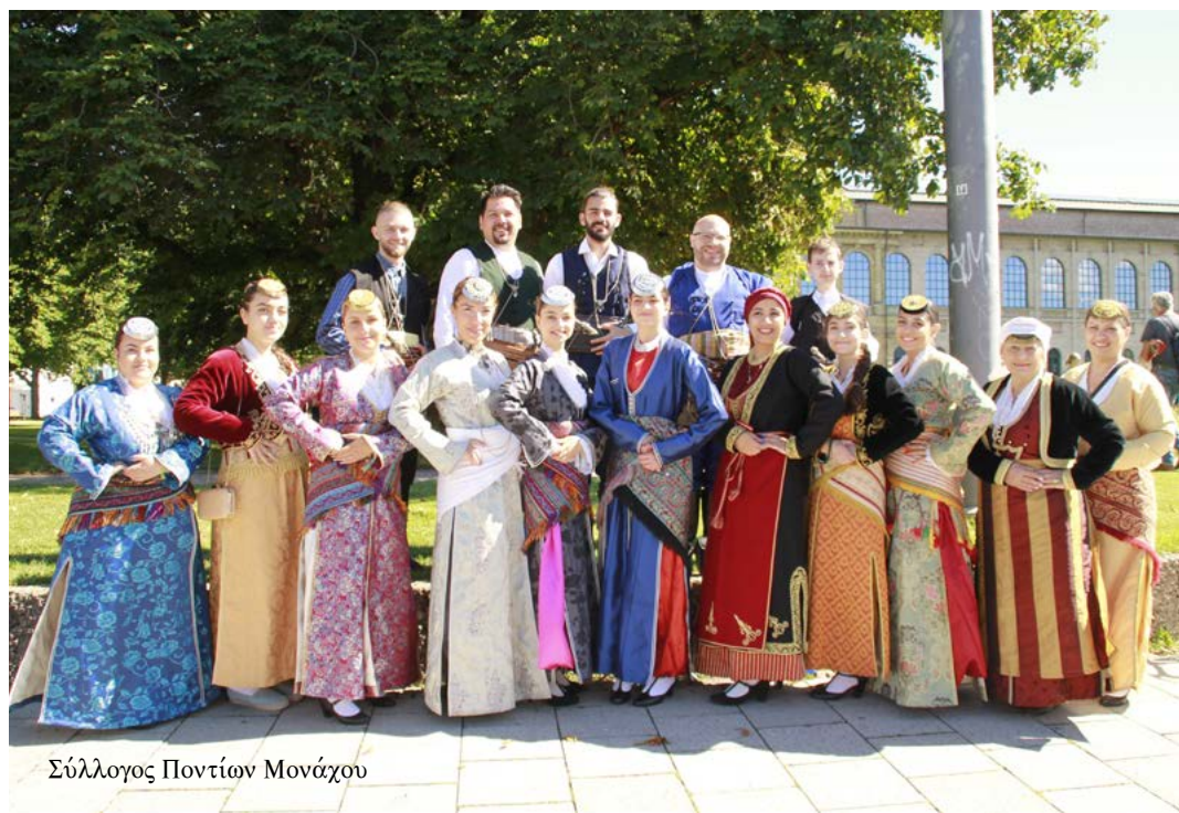
Σύλλογος Ποντίων Μονάχου