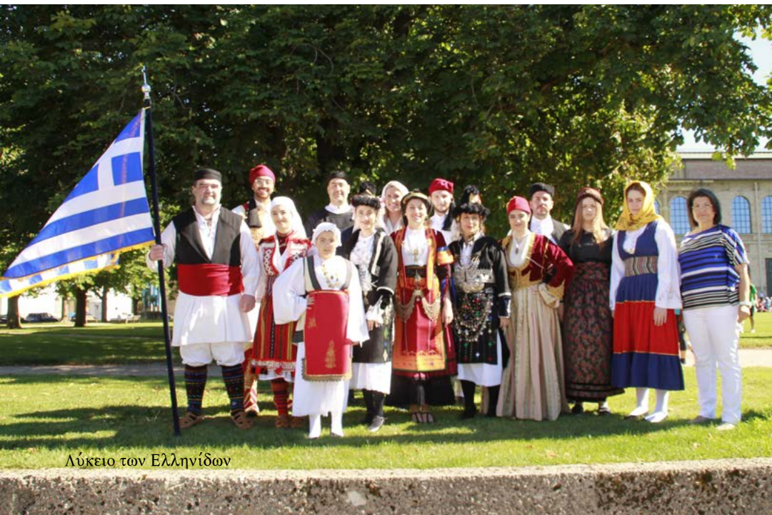
Λύκειο των Ελληνίδων