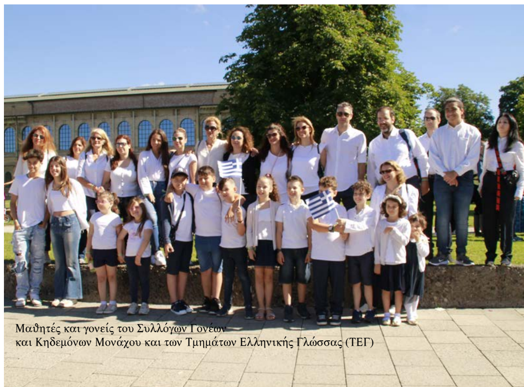
Μαθητές και γονείς του Συλλόγων Γονέων και Κηδεμόνων Μονάχου και των Τμημάτων Ελληνικής Γλώσσας (ΤΕΓ)