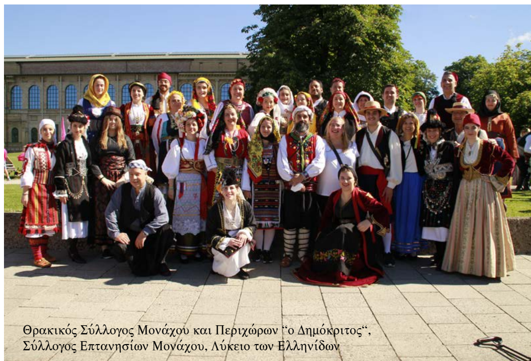
Θρακικός Σύλλογος Μονάχου και Περιχώρων “ο Δημόκριτος“, Σύλλογος Επτανησίων Μονάχου, Λύκειο των Ελληνίδων