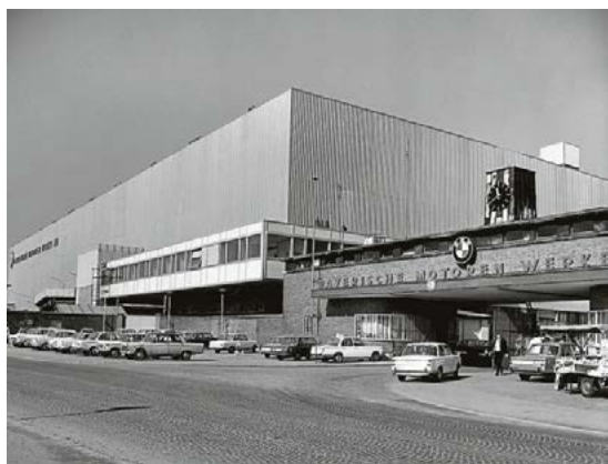
Das Südtor des Werks in München auf einer zwischen 1969 und 1970 entstandenen Aufnahme. Links eine BMW-Flotte, rechts ein Obst- und Gemüsestand.