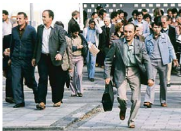
Schichtwechsel Ende der 1960er: Das Foto zeigt, wie multikulturell BMW schon damals war.