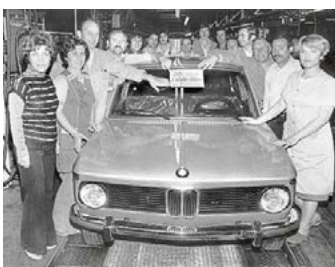
Abschied vom BMW 1502: „Ich bin der letzte Kleine vom Erfolgsmodell“ steht auf dem Zettel.