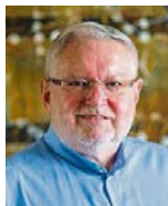
Spektakulärer Wechsel: Anselm Bilgri.