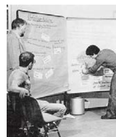
BMW richtete eigene Lernwerkstätten speziell geschult und weitergeb