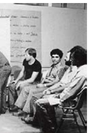
ein, in denen die Gastarbeiter ausgebildet wurden.