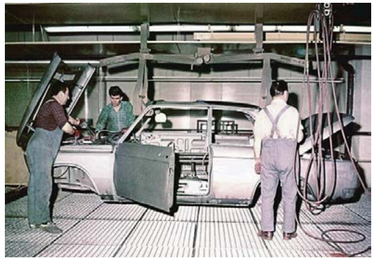
Irgendwann zwischen 1966 und 1975: Das Foto zeigt Arbeiter, die einen BMW 02 montieren. Das genaue Aufnahmedatum des Fotos ist nicht bekannt.