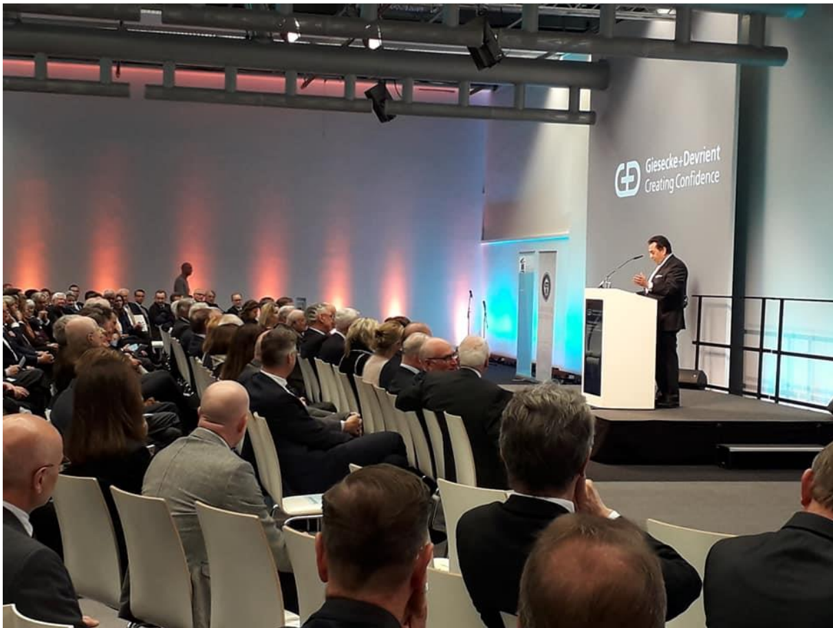
Ο Πρόεδρος της Ελληνικής Ακαδημίας Σταύρος Κωσαντινίδης