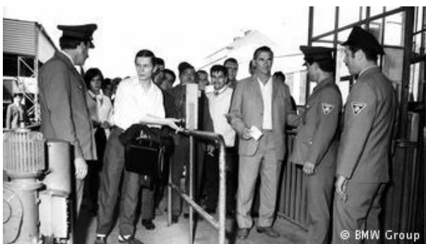
Η νότια πύλη της BMW, 1970