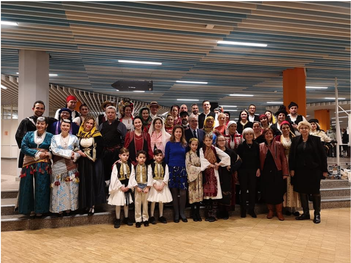
Χορευτές από 8 συλλόγους παρουσίασαν τις παραδοσιακές φορεσιές τους