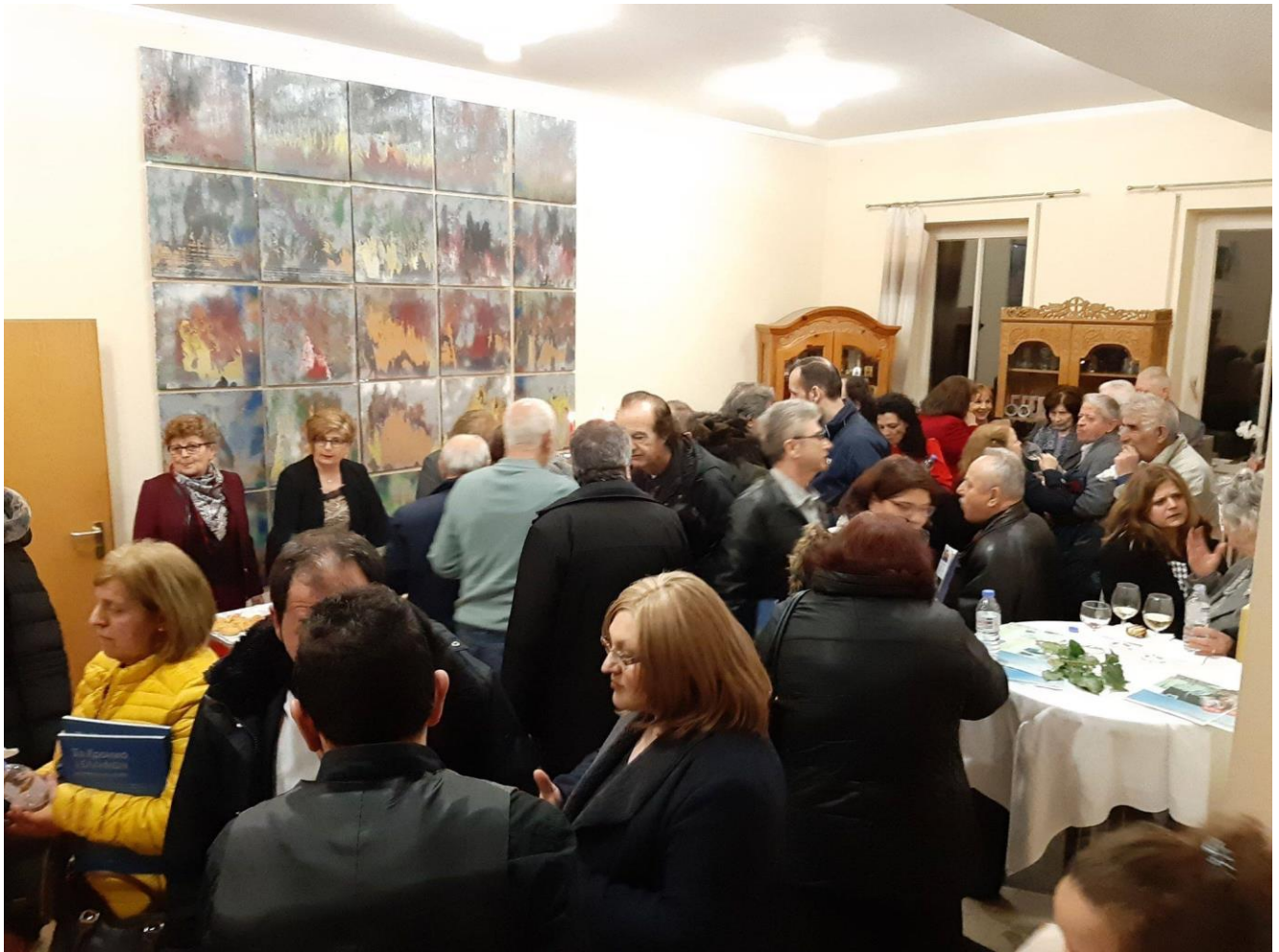
Στη δεξίωση, μετά την εκδήλωση στους χώρους του πνευματικού κέντρου