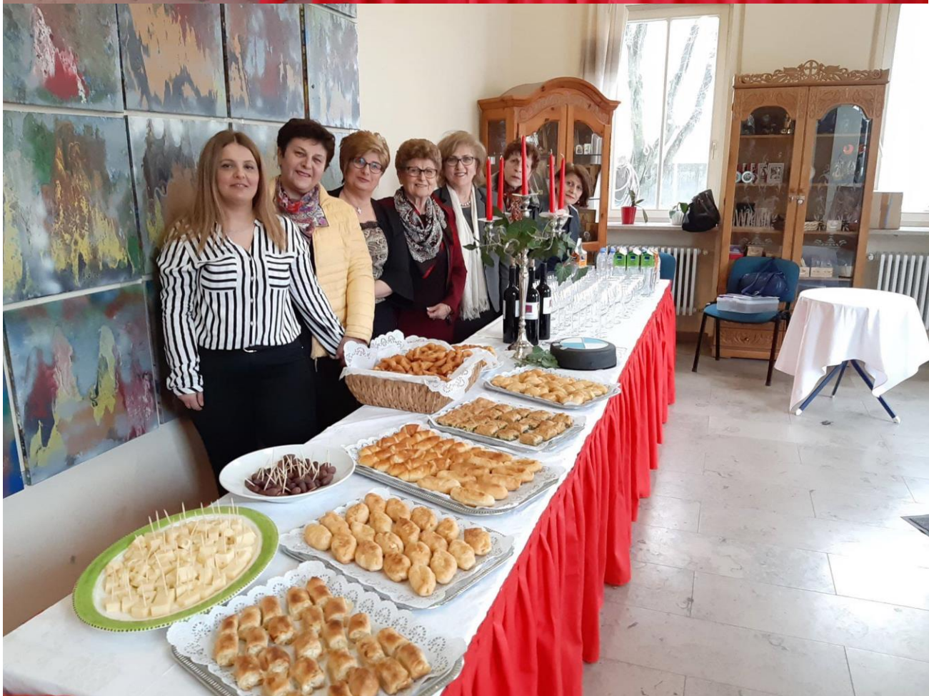
Ο εθελοντισμός στην πράξη : Οι παρχαρομένες του Συλλόγου Ποντίων σε ακόμη μια δράση προσφοράς