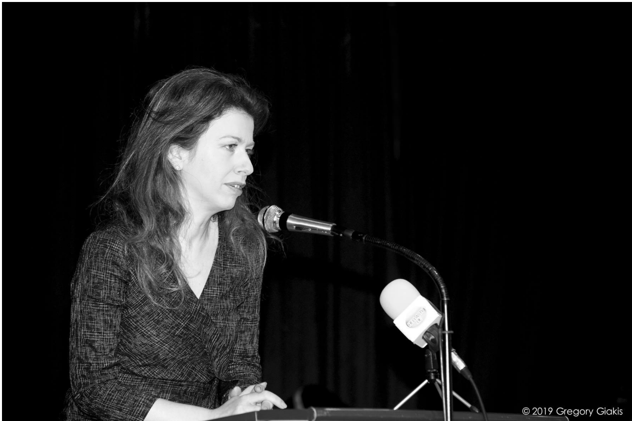
Χαιρετισμός από την Γενική Πρόξενο της Ελλάδας στο Μόναχο Παναγιώτα Κωνσταντινοπούλου