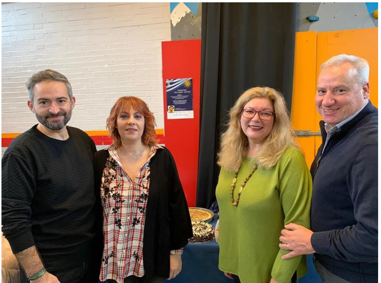
Σύλλογος Μακεδόνων Μονάχου