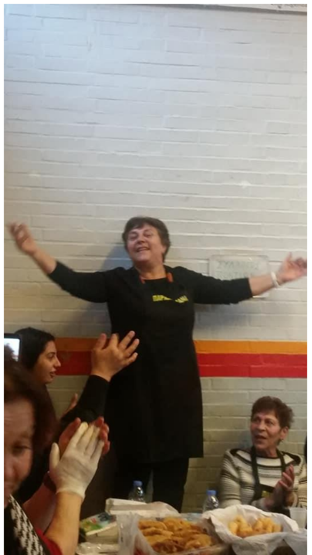
Σύλλογος Ποντίων Μονάχου