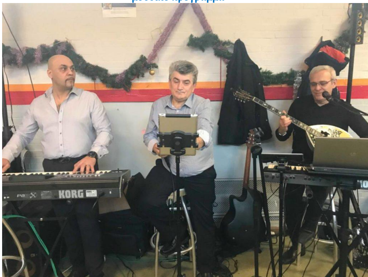
Και φέτος μαζί μας όπως και πέρσι: «Τα παιδιά του Μονάχου»