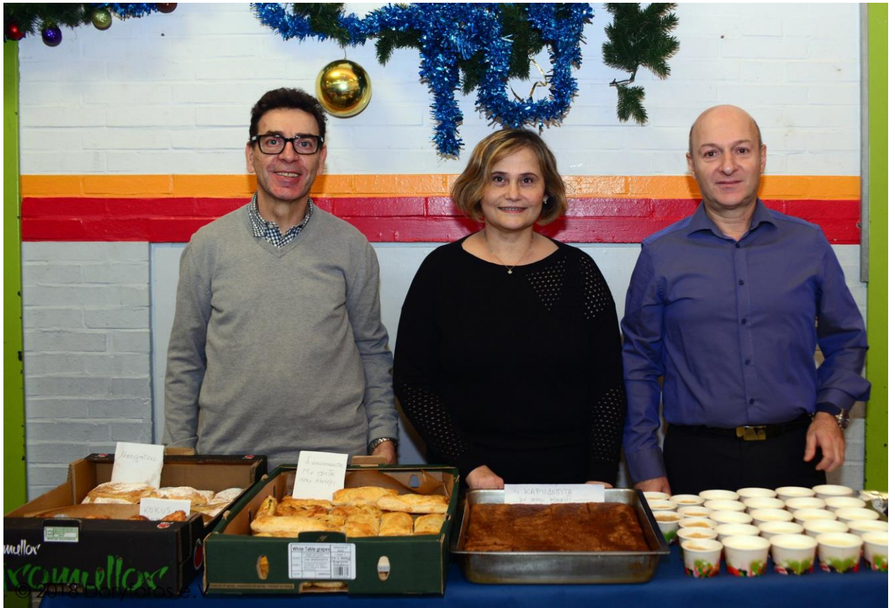
Σύλλογος Αθγαίου Μονάχου