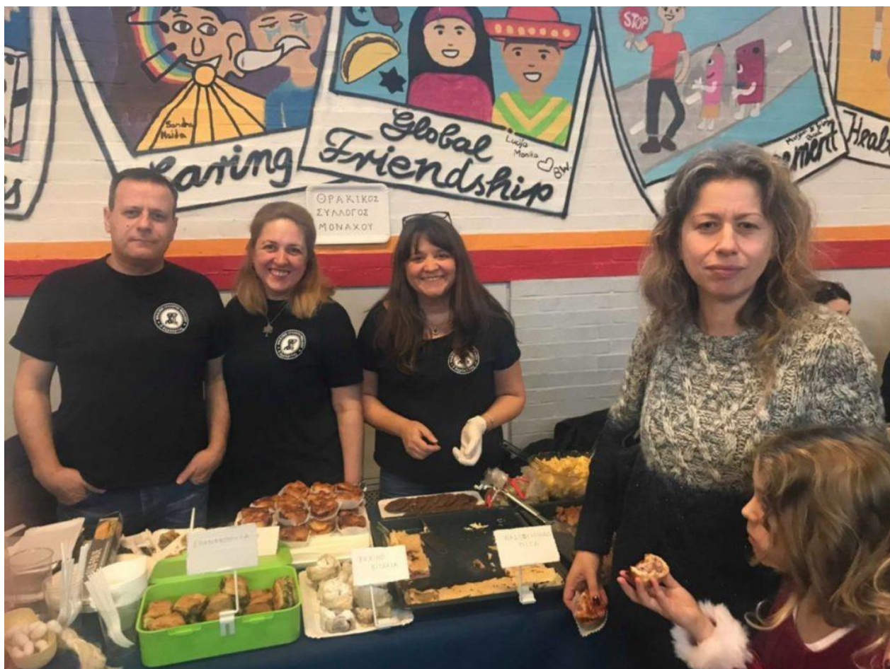
Η Γεν. Πρόξενος της Ελλάδας στο Μόναχο Παναγιώτα Κωνσταντινοπούλου με την κόρη της