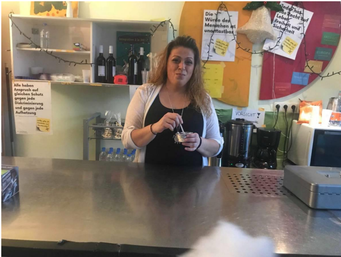
Ο Σύλλογος Γονέων είχε αναλάβει και φέτος μαζί με μαθητές την πώληση καφέ και αναψυκτικών