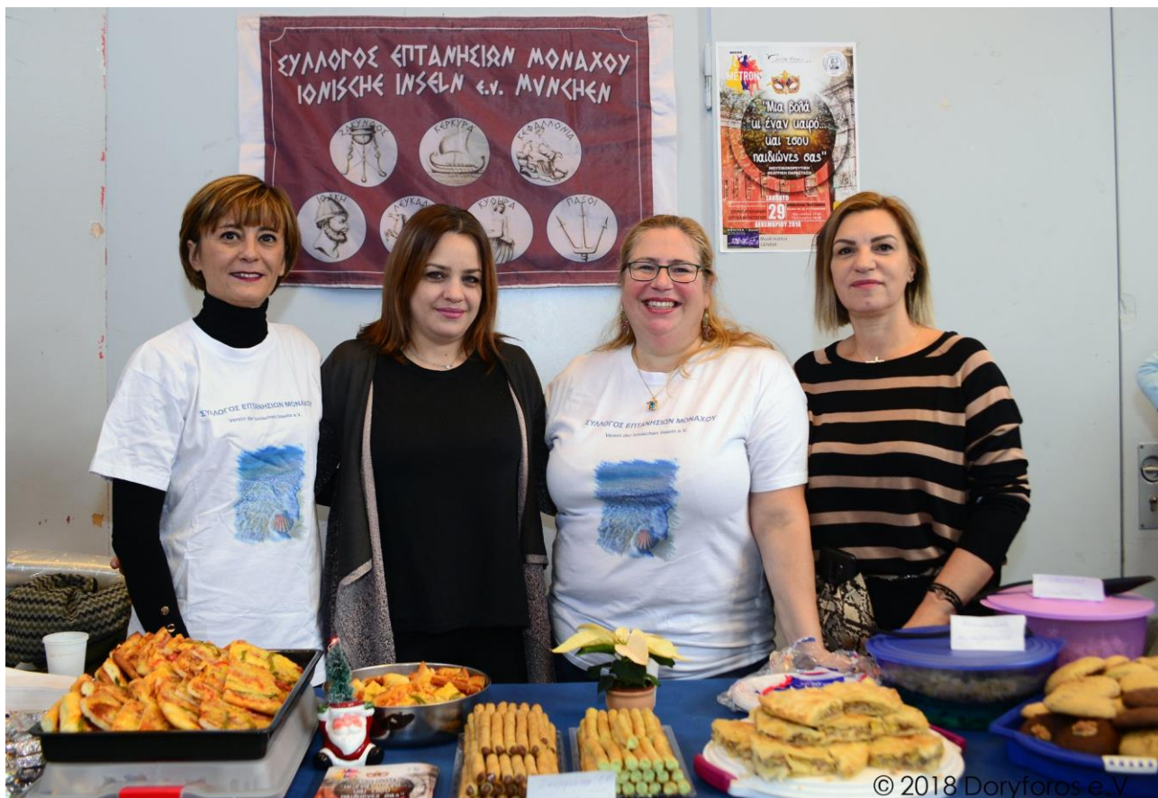
Σύλλογος Επτανησίων Μονάχου