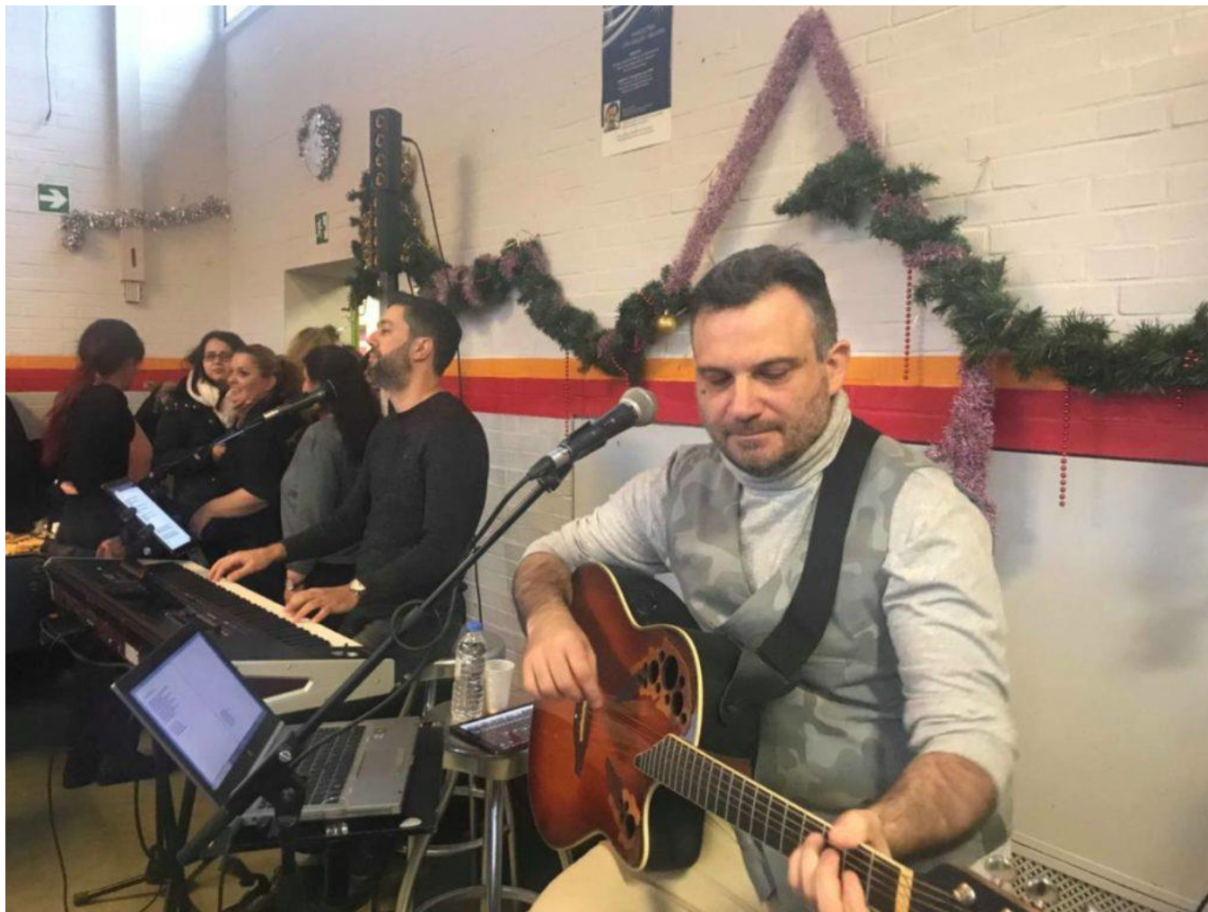
ΗΧΟΧΡΩΜΑΤΑ: Ο Πόλυς και ο Στέλιος για άλλη μια φορά κάλυψαν αφιλοκερδώς μουσικό πρόγραμμα