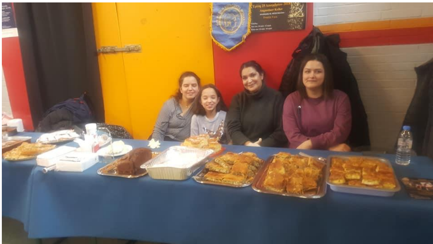
Ηπειρωτική Κοινότητα Μονάχου