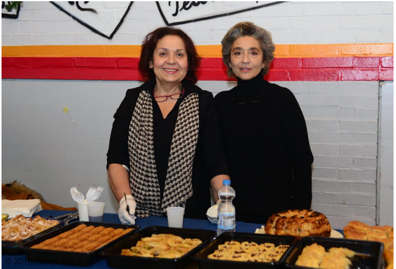
Ενορία Αγ. Γεωργίου