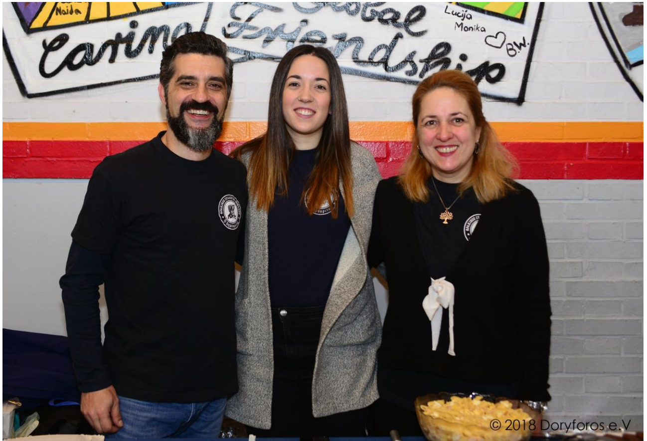
Σύλλογος Θρακιωτών Μονάχου