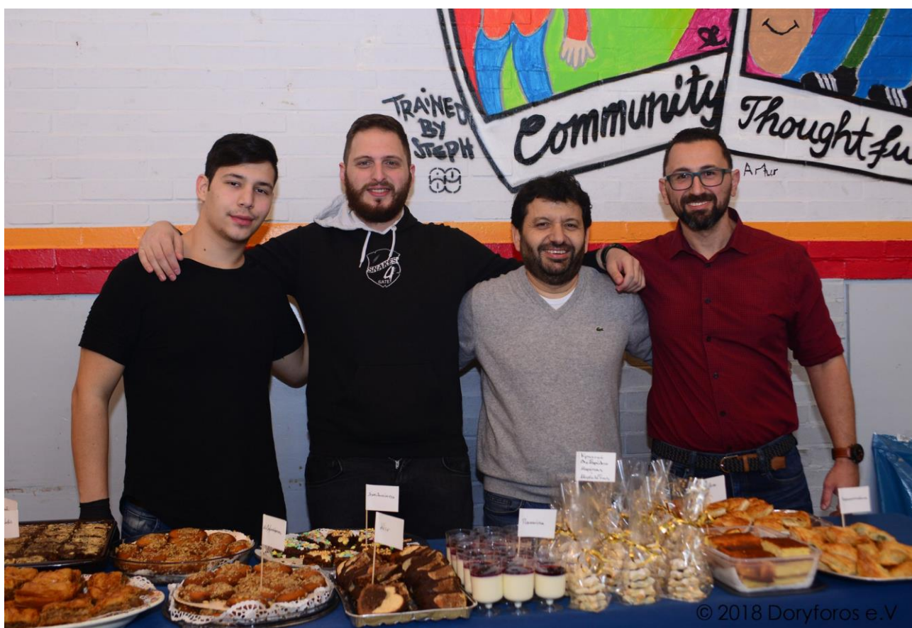
Κρητικός Σύλλογος Μονάχου