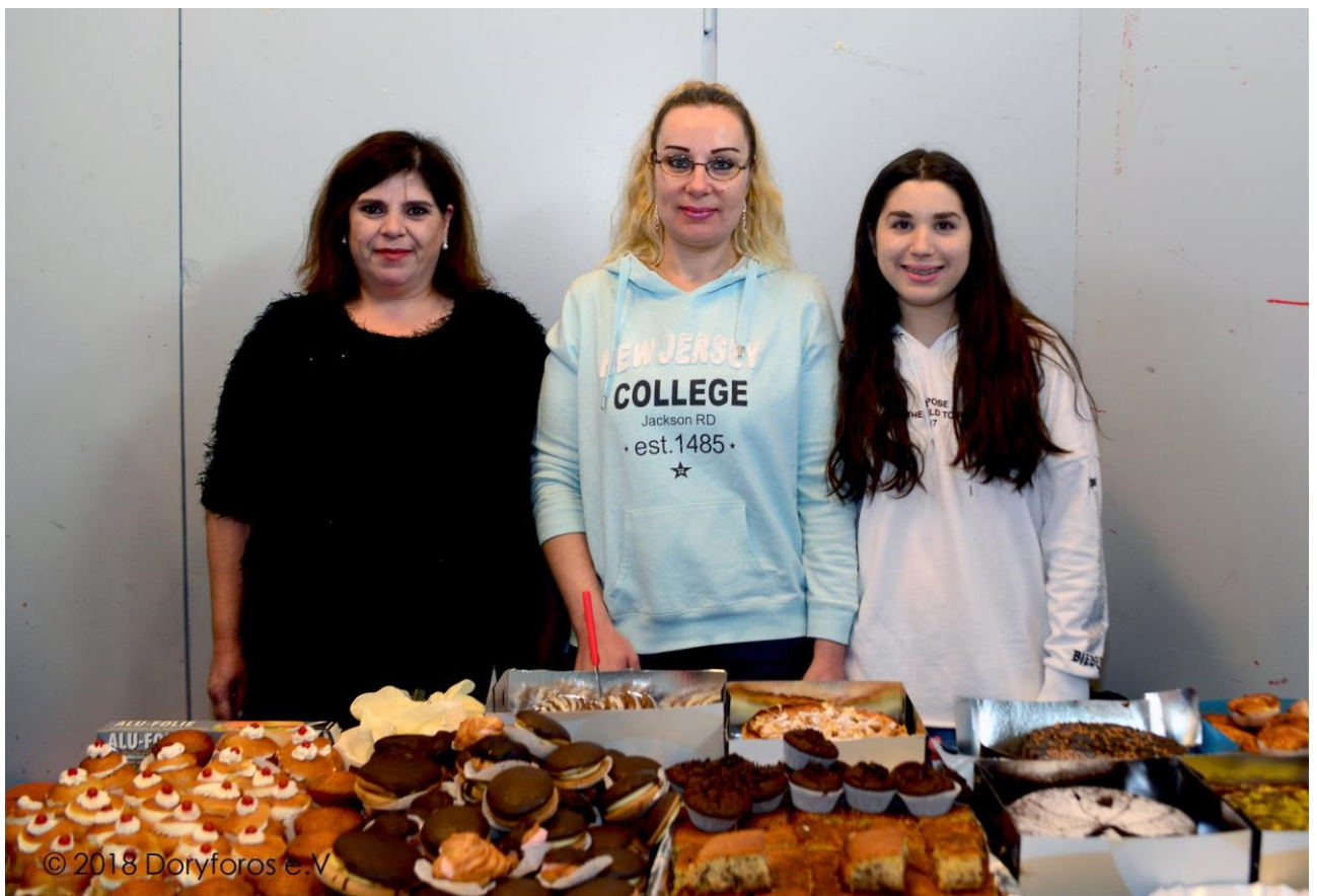
Το τραπέζι του ΔΟΡΥΦΟΡΟΥ με τις εθελόντριες πάλι μαζί μας και φέτος