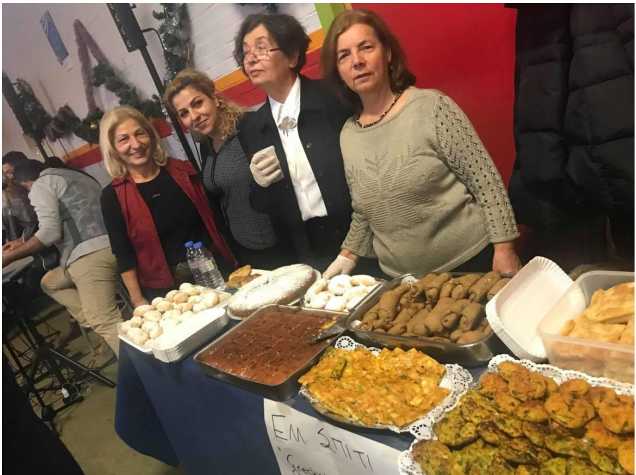
Ελληνικό Σπίτι (γυναικεία ομάδα)