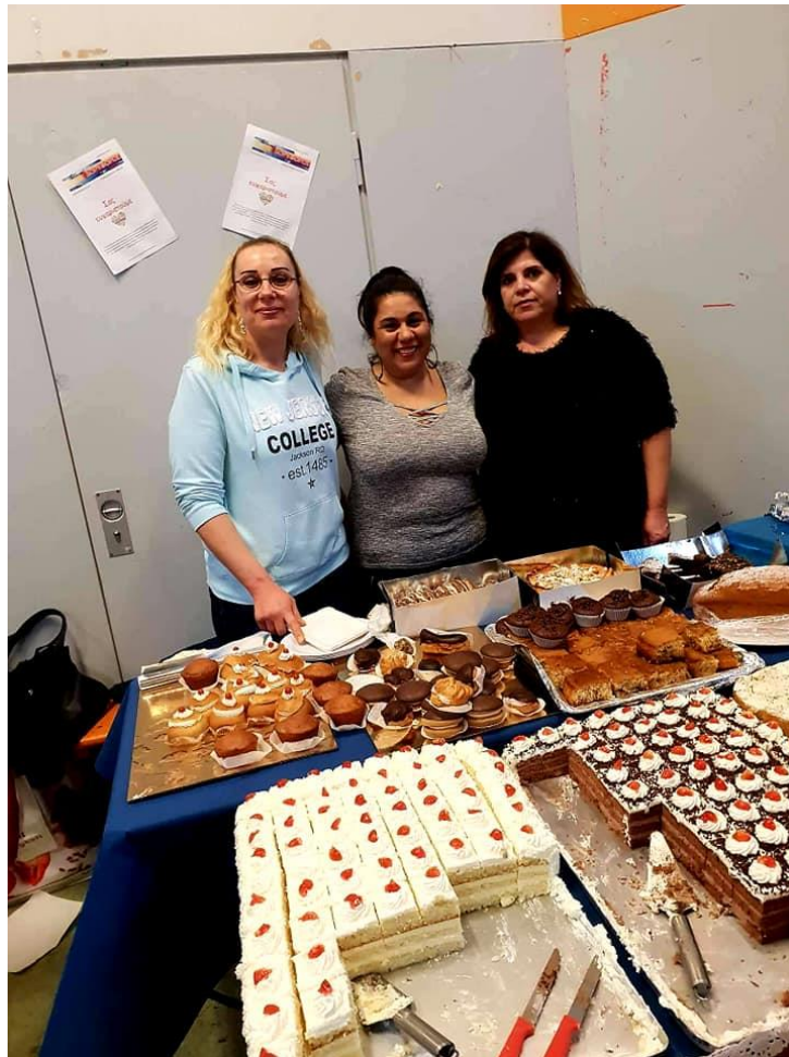
Οι εθελοντές στο τραπέζι του ΔΟΥΡΥΦΟΡΟΥ