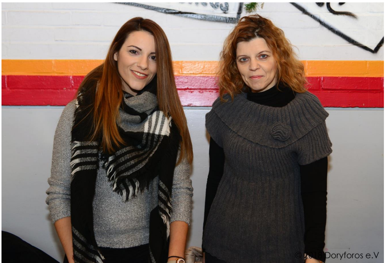
Σύλλογος Ελασσονιτών Μονάχου