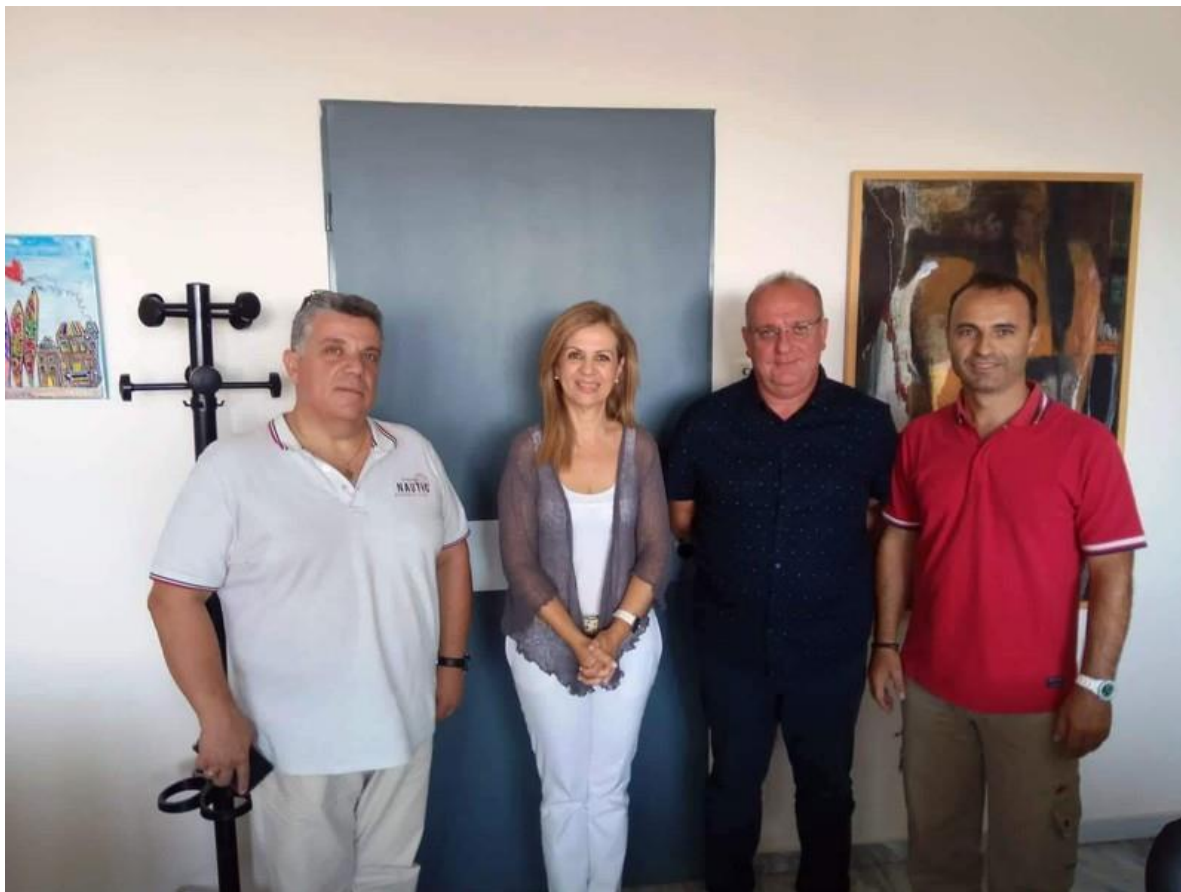
ΔΕΛΤΙΟ ΤΥΠΟΥ ΤΗΣ ΕΛΜΕ ΒΑΥΑΡΙΑΣ Μόναχο, 15.09.2018