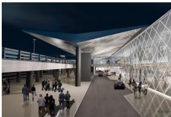
Αεροδρόμιο Θεσσαλονίκης. Μακέτα Fraport

Έως το 2021 θα έχουν ολοκληρωθεί τα έργα αναμόρφωσης στα 14 περιφερειακά αεροδρόμια, όπως επιβεβαίωσε ο διευθύνων σύμβουλος της Fraport Greece Αλεξάντερ Τσίνελ σε σημερινή συνάντηση ενημέρωσης με τους δημοσιογράφους.