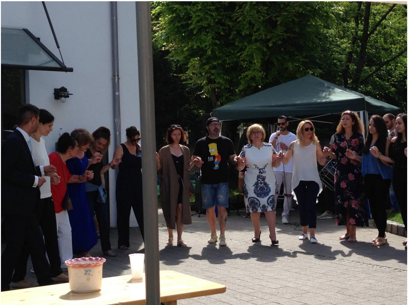
Ποντιακοί χοροί στους ρυθμούς των Νίκο Μουσιάδη, Σάκη Αντωνιάδη, Αγγελου και Παύλο Χαρτοματισίδη