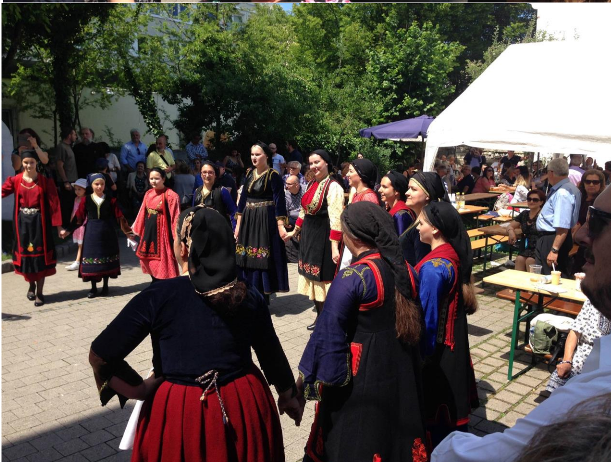
Χορευτικό συγκρότημα Ηπειρωτικής Κοινότητας Μονάχου