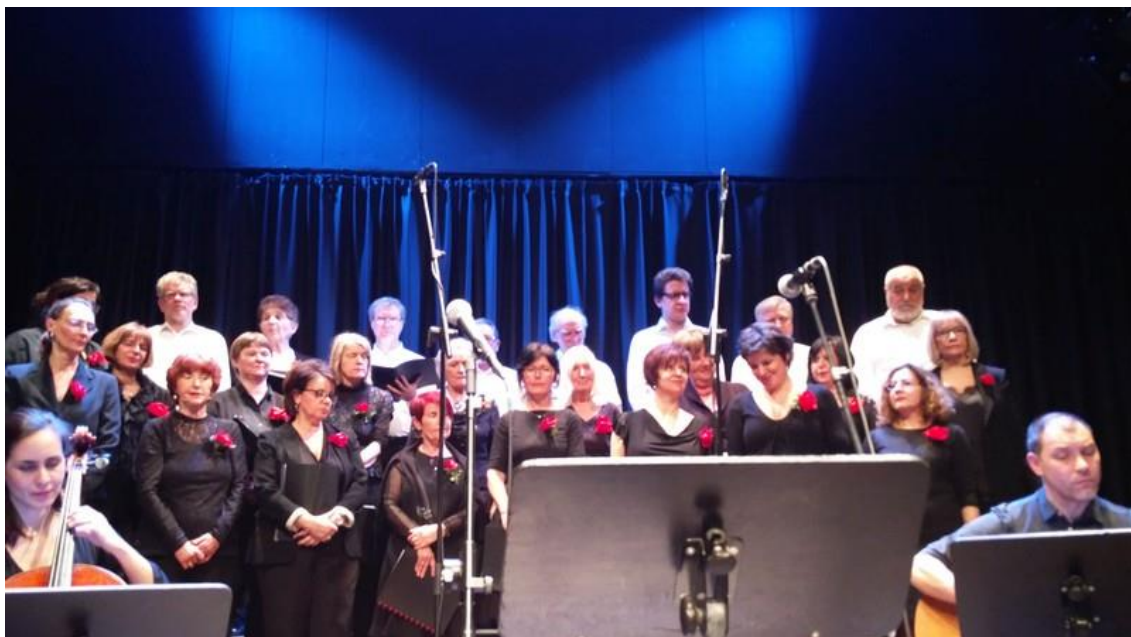
Αφιέρωμα: Ελληνογερμανικός μουσικός σύλλογος "Philharmonia" Μονάχου