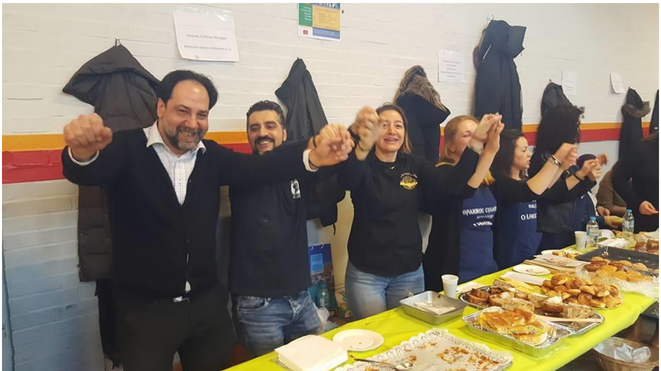
Το τραπέζι των Θρακιωτών με τη συμπαράσταση της «Κρήτης» και φέτος σε ρυθμούς χορού