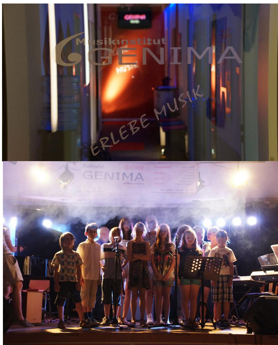
Το Ωδείο GENIMA στο Μόναχο, Sonnenstraße 15 80331 München,