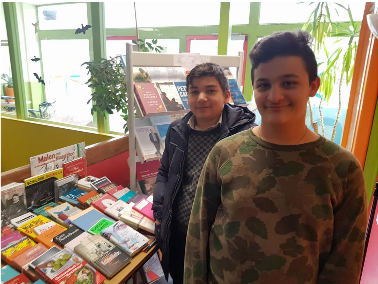
Οι μαθητές εθελοντές του Γυμνασίου Κώστας Τικισιρμάς (πίσω) και Χάρης Κεσιδής