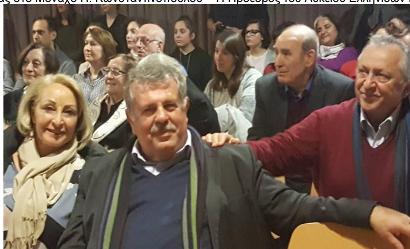
Άποψη από την εκδήλωση