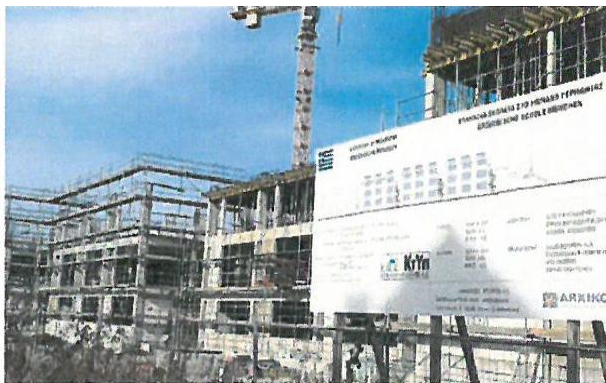
Vertraglich vereinbart: Kräne, Maschinen und gelagertes Material sollen von den Griechen abgebaut werden. FOTO: ICK-DIETL

Ο Δήμος δεν έχει καμία πληροφορία όσον αφορά την προσφυγή της ελληνικής πλευράς επισημαίνει η αρθρογράφος.