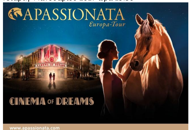
APASSIONATA „Cinema of Dreams“ Olympiahalle Παρασκευή 06.01.17, ώρα 15.30 Uhr και Κυριακή 08.01.17 ώρα 14.00