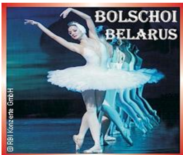
Bolschoi Staatsballett Belarus: Schwanensee, Das Original 02.01.2017 2017, ώρα 20:00 Philharmonie im Gasteig, Rosenheimer Straße 5, 81667 München