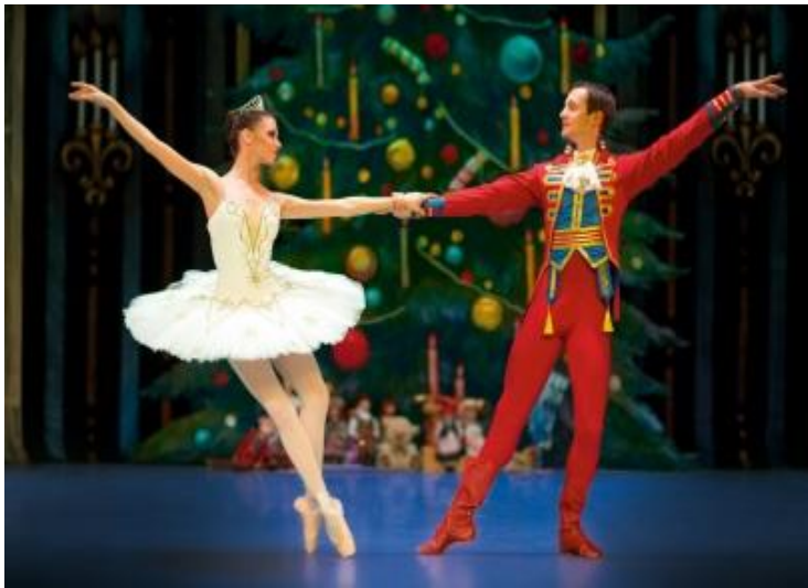
Der Nussknacker St. Petersburg Festival Ballett Σάββατο 17 Δεκεμβρίου 2016 15:30 Σάββατο 17 Δεκεμβρίου 2016, 19:30