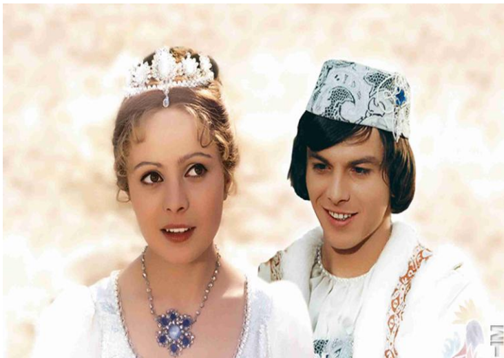
Drei Haselnüsse für Aschenbrödel, Gasteig Κυριακή 18 Δεκεμβρίου 2016, ώρα 11:00, Και Παρασκευή 23. Δεκεμβρίου 2016, ώρα 15:00